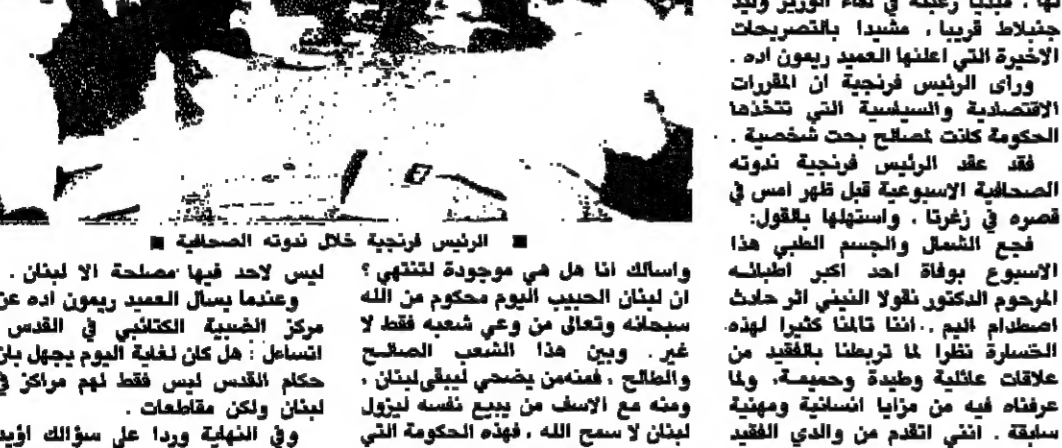
الرئيس فرنجية خلال نوبته الصباحية